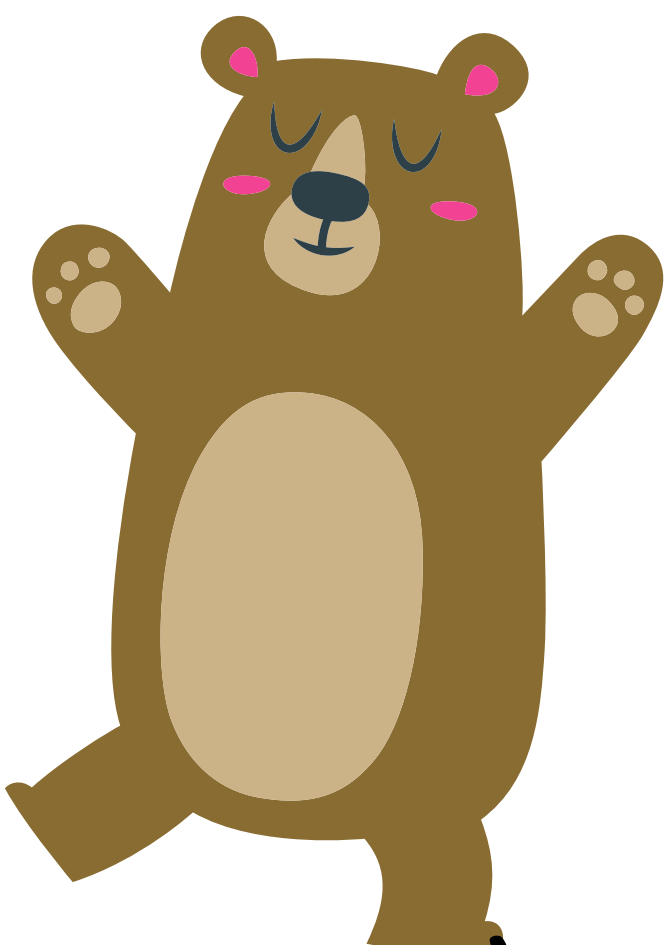
FIER / FIÈRE