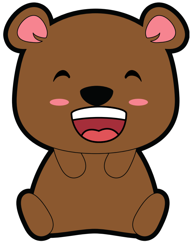
JOYEUX / JOYEUSE