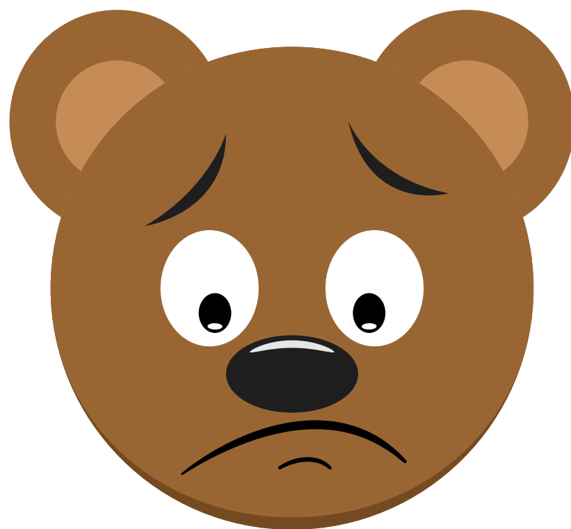
INQUIET / INQUIÈTE