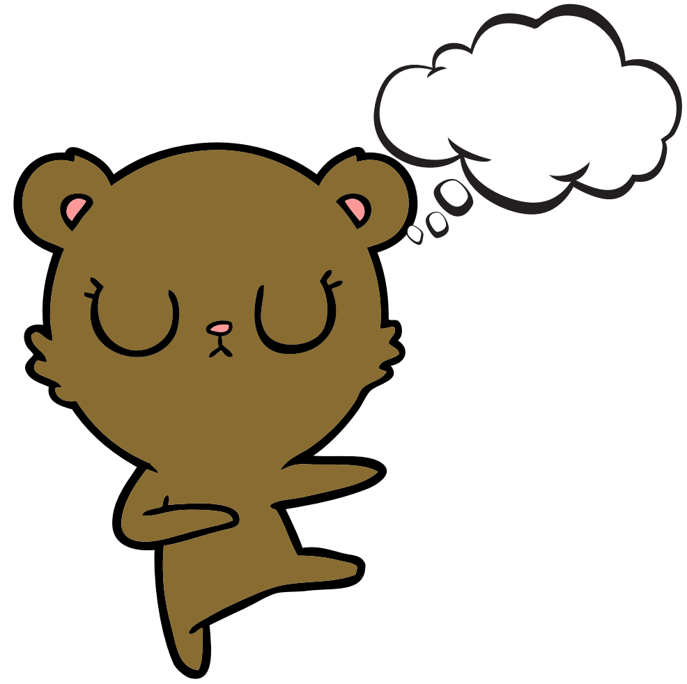
RÊVEUR / RÊVEUSE